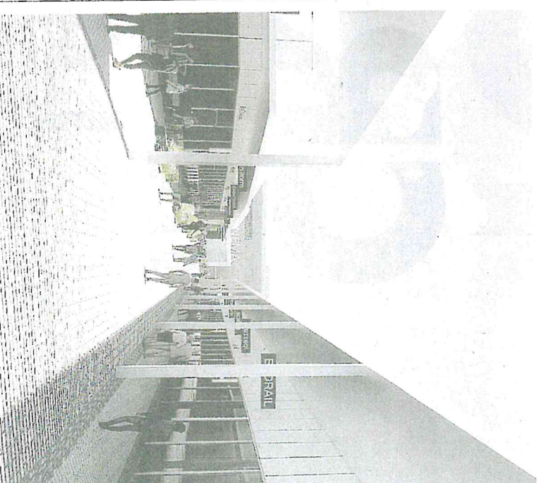
Nei rendering l'aspetto che avrà la cascina dopo i lavori